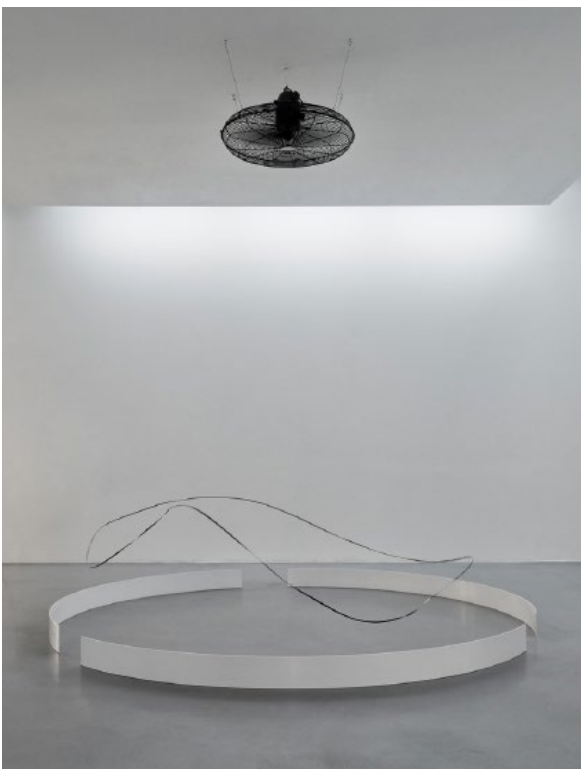
Zilvinas Kempinas, OASIS, 2009, Centre national des arts plastiques © Adagp Paris